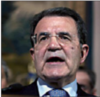
Il premier Romano Prodi