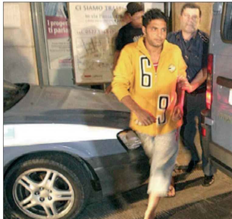
Il fermo di uno dei clandestini scoperti in via Roma, in città

Fermati 17 irregolari, blitz in alloggi fatiscenti