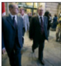
Epifani a Reggio

Arriva da Reggio la replica del segretario nazionale Cgil Epifani, alla proposta di Confindustria di un "patto per la produttività", ed è un no: «Occorre un patto contro la precarietà». Finanziaria? «Non solo tagli».